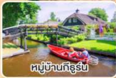
หมู่บ้านทีร์ูร์น