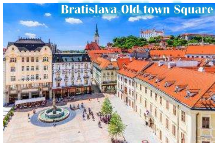
Bratislava Old town Square

บ่าย นำท่านเดินทางสู่กรุงบราติสลาวา, ประเทศสโลวัก นำท่านเข้าชมเมืองเก่าบราติสลาวา สัมผัสบรรยากาศเมืองเก่า และถ่ายภาพกับโรงละครโอเปร่า สัญลักษณ์แห่งความหรรษาของประเทศ และเก็บภาพรูปปั้นที่ซ่อนอยู่ในตัวเมือง ไม่ว่าจะเป็นรูปปั้นโปเลียนหน้าสถานทูตฝรั่งเศส หรือรูปปั้นปาปาริซซ์รวมถึง ไฮไลต์ของเมืองคือรูปปั้นของคนที่ตกท่อคูมิล” (Man at Work) ที่โด่งดัง ณ แห่งนี้เคยถูกรถชนมาแล้วถึง 2 ครั้ง ในปัจจุบันจึงมีป้าย เขียนว่า “Man at Work” ปักอยู่บริเวณดังกล่าว เป็นสัญลักษณ์ช่วงที่เป็นคอมมิวนิสต์ และตำนานยังคงกล่าวต่อไปว่าอาจจะเป็นคุณลุงที่เหน็ดเหนื่อยกับการทำงานอยากจะพักผ่อนบ้างตามประสานักงานหนัก จากนั้นนำท่านชม “ประตูไมเคิล” ซึ่งซุ้มประตูไมเคิลก่อสร้างสไตล์โกธิคสูง 51 เมตร มีอยู่ทั้งหมด 4 แห่ง ปัจจุบันเป็น ประตูเพียงแห่งเดียวที่ยังเหลืออยู่ ประตูไมเคิลมียอดโดมทรงหัวหอมตามศิลปะบารอก 3 ชั้น ลดหลั่นกัน ประตูแห่งนี้ตั้งอย่างศูนย์กลางเมืองเก่า สองฝั่งถนนมีอาคารเก่าแก่หลาก สี สัน สไตล์อาร์ตนูโวตั้งเรียงรายอยู่ทำให้บรรยากาศคึกคัก