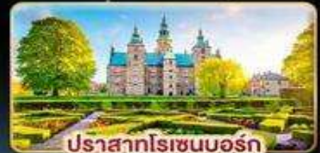
ปราสาทโรเซนบอร์ก