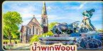
น้ำพุเกฟออน