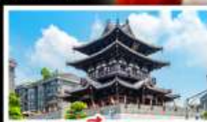
เอาเซ็งวาเซา