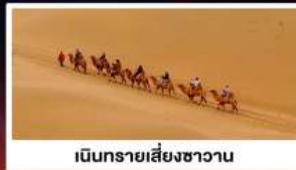
เนินทรายเสี่ยงชาวน