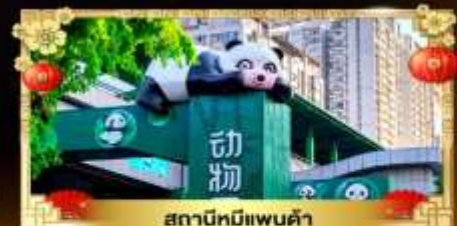
สถานีหมีแพนด้า