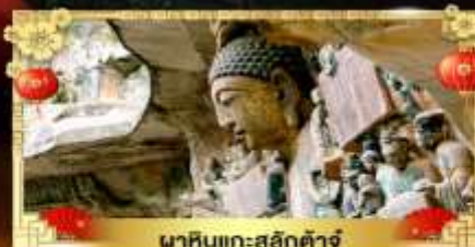
นาหินแกะสลักต้าจู่