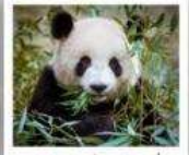
ศูนย์หมีแพนด้าดูเจียงเยียน