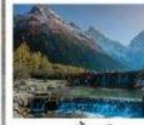
อุทยานปี้เผิงโกว