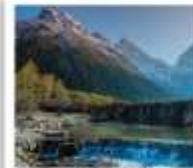
อุทยานปี้เฉิงโกว