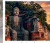
หลวงพ่อดเล่าซาน