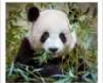
ศูนย์หมีแพนด้าฉู่เจียงเยียน