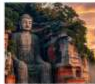
หวงโถวเสื่อซาน