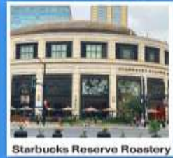
Starbucks Reserve Roastery