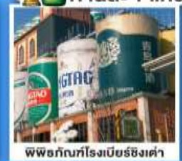
พิพิธภัณฑ์เบียร์ชิงเต่า