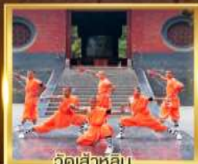
วัดเล่าหลิน