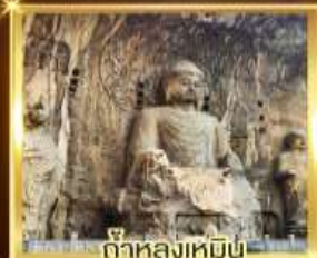
ถ้ำหลงเหมิน