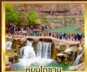
หยุ่นโกซาน