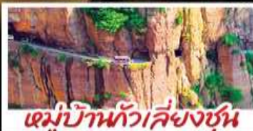
หมู่บ้านทิวเสี่ยงซุน