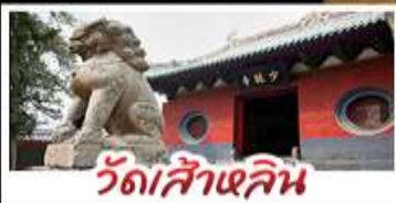
วัดส่าหลิน