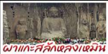
ผาแกะสลักเสลงเหมิน

ถ้ำหลงเหมิน - สุสานจิ๋มซีซ่งเต๋ - วัดส่าหลิน หมู่บ้านไต้ตั้นสามโจ้ว - หมู่บ้านทิวเสี่ยงซุน