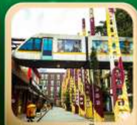
“ดงเจียวจื่อ”