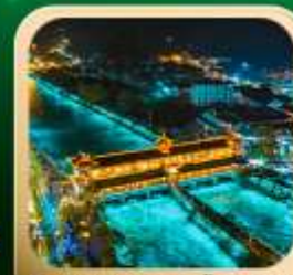
“สะพานหนานเฉียว น้ำตาสีฟ้า”