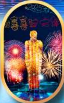
หมู่บ้านเนียนฮิววาน