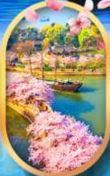
ล่องเรือสวนหยวนโกวจู่