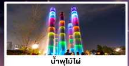
น้ำพุไม่ไผ่