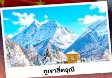
ภูเขาสีครุณี

เที่ยว 3 อุทยานแล้วรอดแห่งมณฑลเสฉวน ถ่ายรูปชิคอินน้ำพุไม่ไผ่ยักษ์ เดินเล่นถนนโบราณ