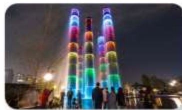
น้ำพุไม้ไผ่