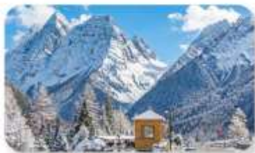
ภูเขาสี่ครุณี