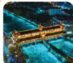
"สะพานหมานเจียว"