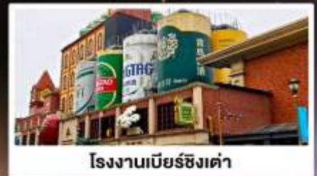
โรงงานเบียร์ชิงเต่า