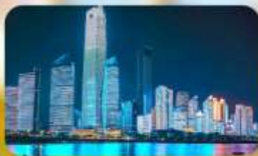
หาดไฮเบอร์ฟังก์