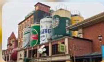
โรงงานเบียร์ชิงเต่า