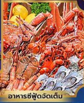
อาหารซีฟู้ดจัดเต็ม

บุฟเฟต์เบียร์ไม่อื่น + ซีฟู้ด + ปิ้งย่างเกาหลี