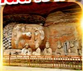
พระแกะสลักหินต้าจู๋