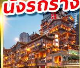
หงหย้าตัง

บินตรงเชียงใหม่ลงชิง นั่งรถรางชมวิวอุทยานนางฟ้า