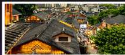
เมืองโบราณสือปาตี