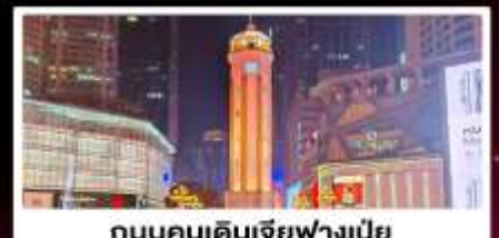
ถนนคนเดินเจียฟางเป็ย