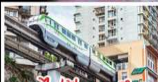
รถไฟฟ้าทะเลสาบ