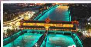
สะพานเทานางฟ้า