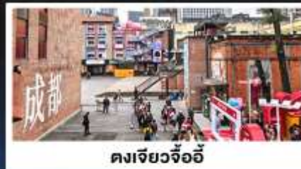
ตงเจียวจ้ออี้