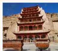
ถ้ำม่อเกาคุ