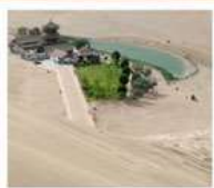
เขื่อนทรายหมิงซาซาน