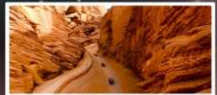
แกรนด์แคนยอนอาตุซื่อ