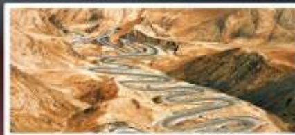
ถนนโบราณผืนหลงกู่เต้า