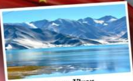
ทะเลสาบโปซาทุ

เปิดประตูสู่อารยธรรมพันปีแห่งซินเจียงใต้ ชมความสวยงามของหมู่บ้านดอกแอปเปิ้ล