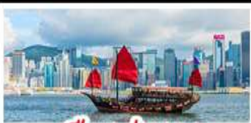
เมืองอ่องกง

เมืองเก่าซิงเต่า - วิวเมืองอ่องกง โรงเบียร์ซิงเต่า - ท่าเรือชาวประมงเยียนโต