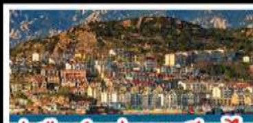
ท่าเรือชาวประมงเยียนโต