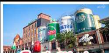
โรงเบียร์ซิงเต่า