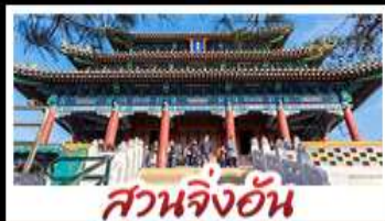
สวนจิ้งอัน