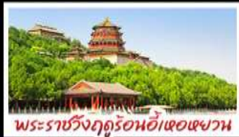
พระราชวังฤดูร้อนอี้เหอหยวน

ท่าแพงเมืองจีนค่ามจวียงกวน - พระราชวังฤดูร้อนอี้เหอหยวน สวนจิ้งอัน - วัดลามะ - โม่หลงร้านช้อปปิ้ง - โรงแรม 4 ดาว มื้อพิเศษ เปิดบิกกิ้ง สุก๊นงโกนา MICHELIN GUIDE ร้าน TAO TAO JU