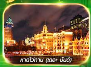
หาดว่ทาน (เดอะ บันด์)

เที่ยวมหานครเชียงใหม่ ถ่ายรูปเช็คอินท์ Tian An 1000 Trees, ซินเจียงตี้ ช้อปปิ้งตลาดเงินหวงเหมียว, ถนนนานกิง