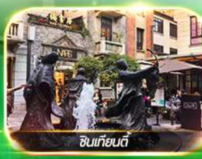
ซินเจียงตี้