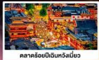
ตลาดร้อยปีเดินหวังเหมียว