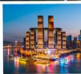
ตึกรูปเฟี๊