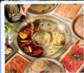
หม้อไฟหมาล่า