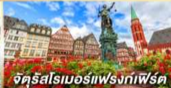
จัตุรัสโรเมอร์แห่งทาร์เปิร์ต