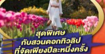
สุดพิเศษ กับสวนดอกทิวลิป ที่จัดเพียงปีละหนึ่งครั้ง