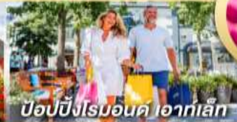
ป๊อปปิงโรมอนด์ ไอคาเล็ก