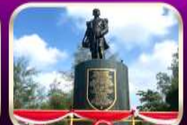
อนุสาวรีย์กรมหลวงชุมพรฯ