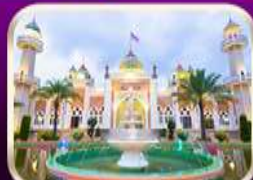
ชมมัสยิดกลางปัตตานี